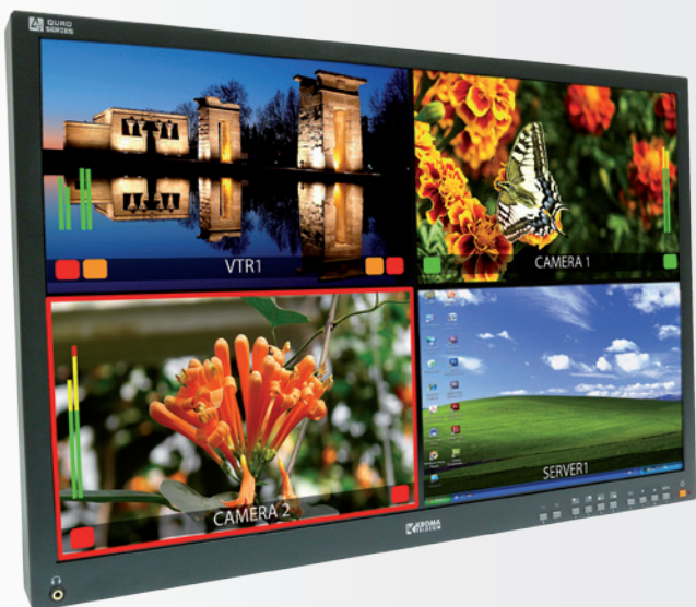
Quadsplit en una pantalla H-IPS Full HD