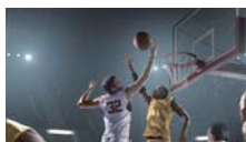
Zoom óptico 12X