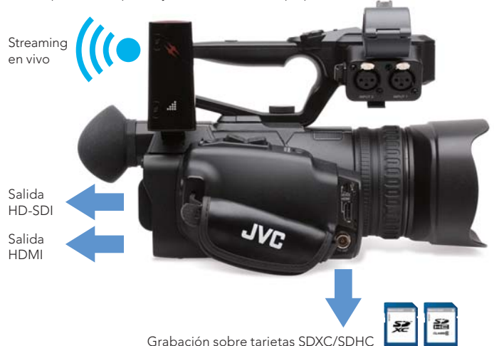
Foto con módem LTE/4G opcional

*Se requiere un adaptador y una conexión a red apropiados