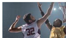
Zoom dinámico 24x en modo HD

El zoom dinámico combina el zoom óptico 12X con la función de mapeado de píxeles, creando un zoom 24X suave, continuo y sin pérdidas.